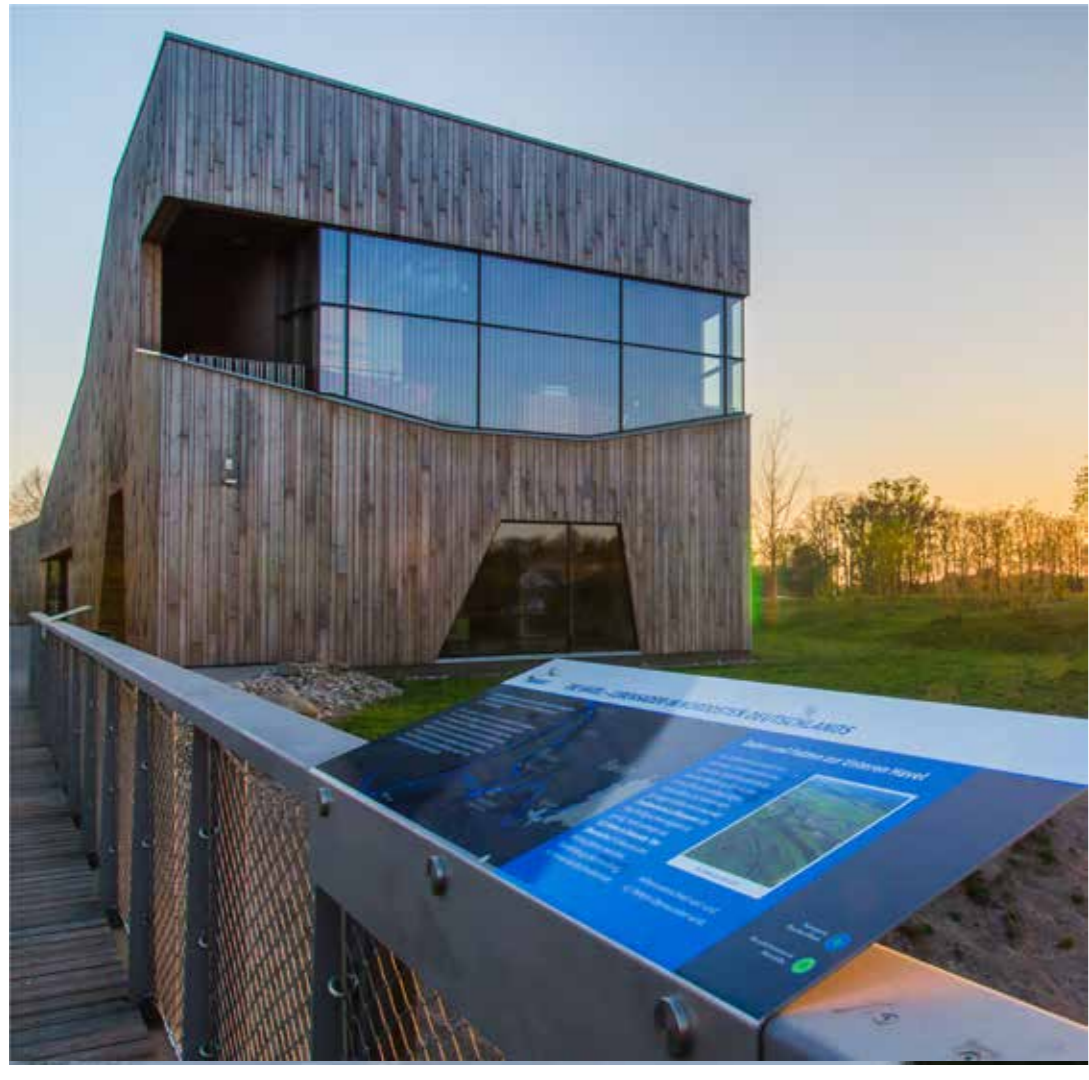
HAUS DER FLÜSSE

DIE MODERNE ARCHITEKTUR FÜGT SICH GUT IN DIE BESTEHENDE STRUKTUR EIN UND DAS INFORMATIONSZENTRUM IST EIN WICHTIGER TOURISTISCHER ANKERPUNKT.