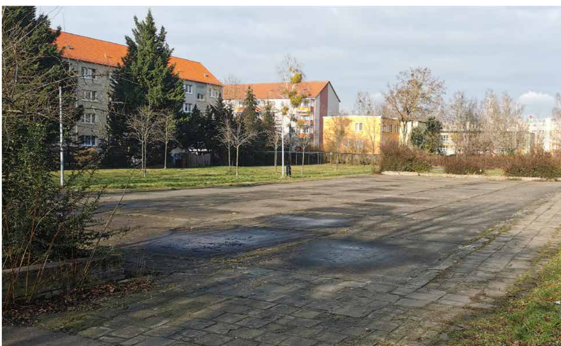
FREIRÄUME IN DER ZEILENBEBAUUNG

DIE BRACHLIEGENDE FLÄCHE AM RANDE DER ALTSTADT WIRKT UNATTRAKTIV. IHRE EXPONIERTE LAGE BIETET VIEL MEHR POTENZIAL.