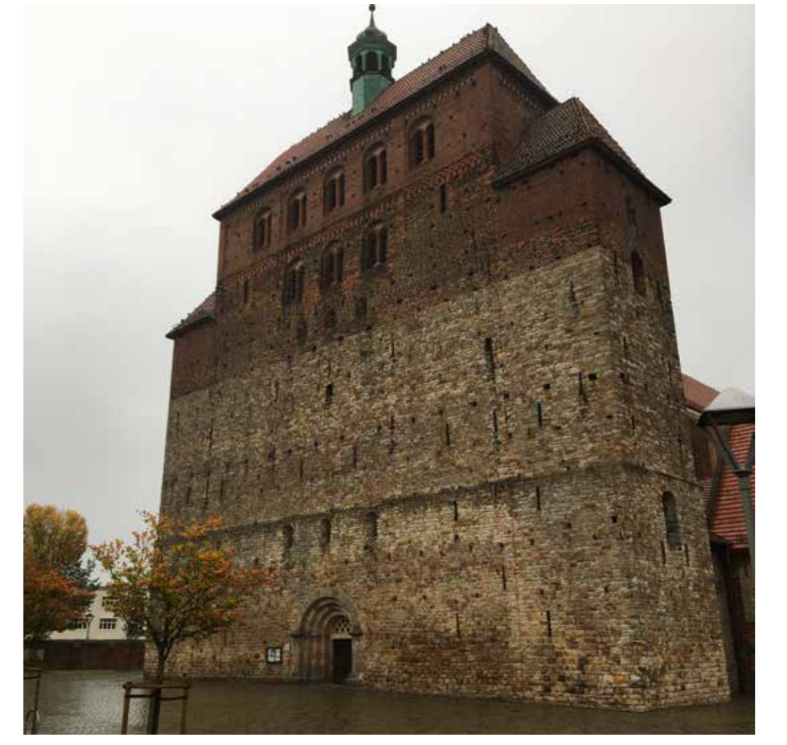
DOM ST. MARIEN

DIE RENOVIERTEN STRASSENZÜGE UND DER GEFLEGTEN ÖFFENTLICHEN RAUM MACHEN DIE ALTSTADT ZU EINEM ATTRAKTIVEN STADTRAUM.