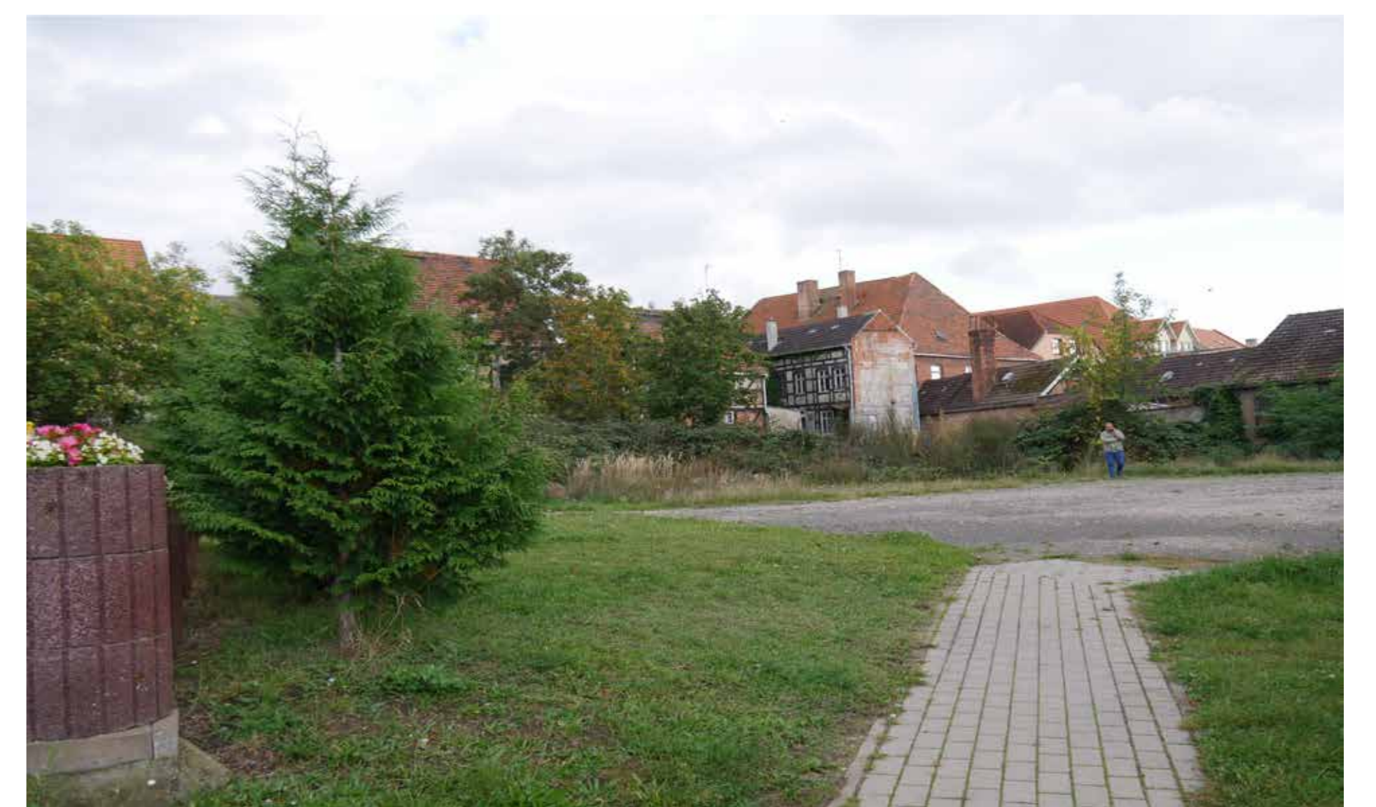
FREIFLÄCHE AN DER UFERSTRASSE

DER DERZEITIGE LEERSTAND DES GEBÄUDEENSEMBLES ENTSPRICHT NICHT DEM POTENZIAL, DAS DIE FLÄCHE BIETET.