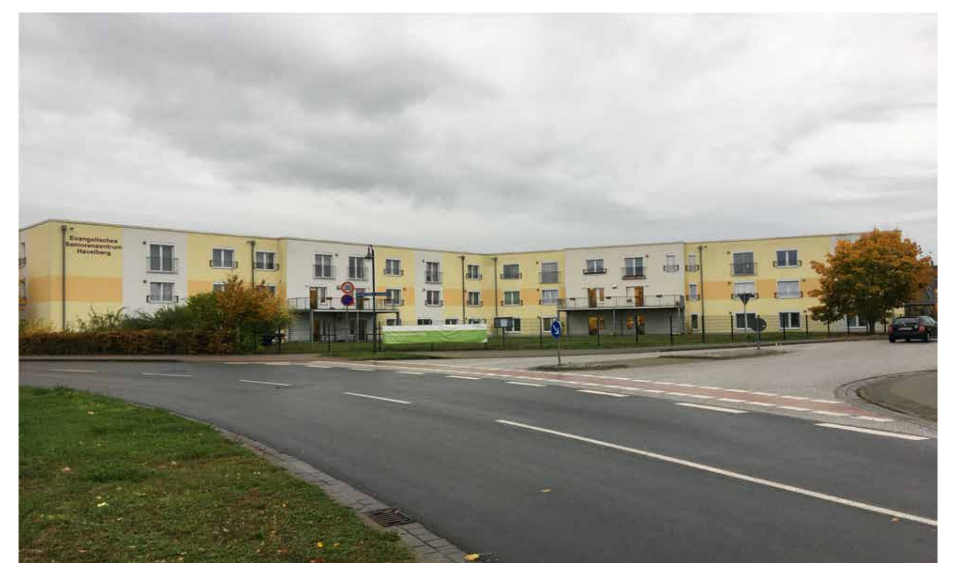
ECKE SEMMELWEISSTRASSE / ROBERT-KOCH-STRASSE

DIE LEERSTEHENDEN WOHN- UND GEWERBEFLÄCHEN DER ALTSTADT SIND NICHT NUR OPTISCH UNSEHNLICH, SONDERN LASSEN AUCH ANGEBOTSLÜCKEN ERKENNEN.