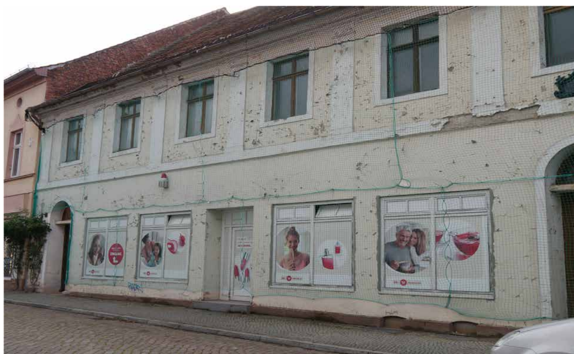
LEERSTAND IN DER ALTSTADT

DIESE FREIEN FLÄCHEN SIND TRIST UND BIETEN WENIG AUFENTHALTSQUALITÄT, OBWOHL IN DER UMGEBUNG DIE MEISTEN HAVELBERGER WOHNEN.