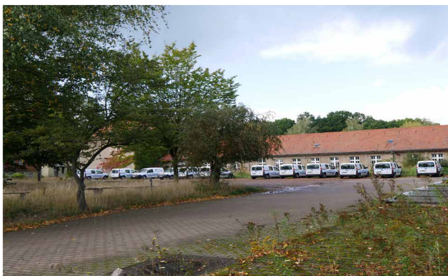
LEERSTAND DER ALTEN SEKUNDARSCHULE

DER GEWERBLICHE NEUBAU AM RANDE DER ALTSTADT WIRKT FEHLPLATZIERT UND ÜBERDIMENSIONIERT. ER FÜGT SICH NICHT GUT IN DIE UMGEBUNG EIN.