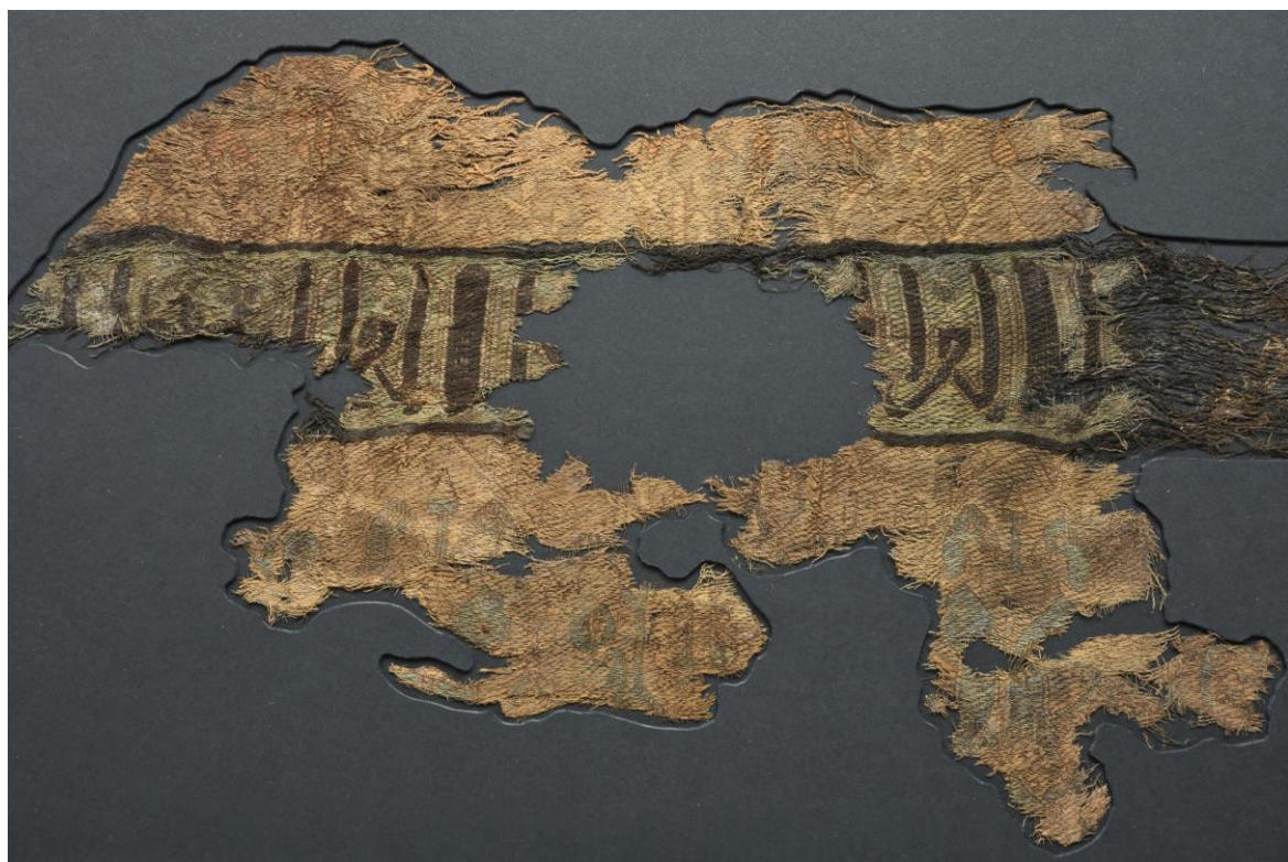
Farbiger Seidenstoff (ca. 12. Jahrhundert) mit eingewebtem arabischen Schriftzug aus dem Grab von Königin Editha.