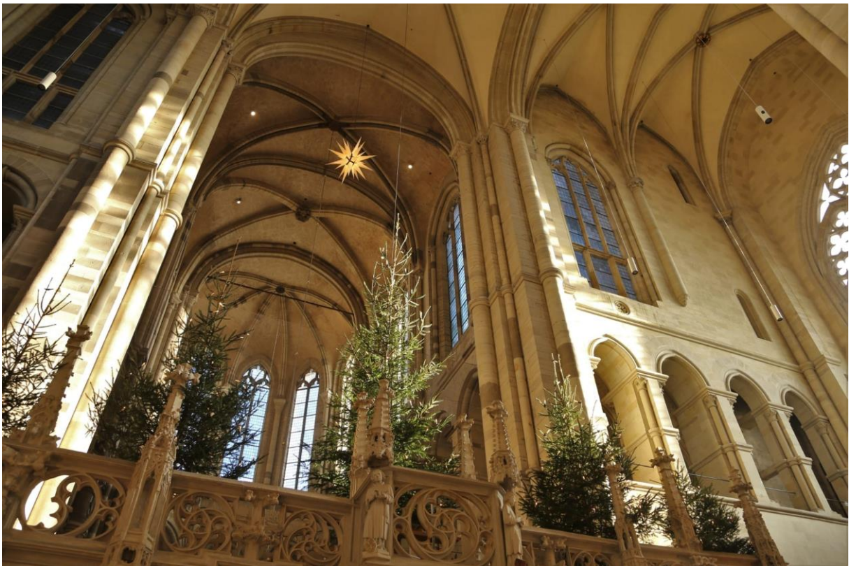
Weihnachtsstimmung in „unserem“ Dom.