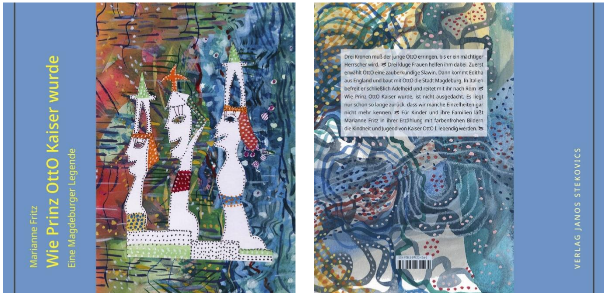
Titel und Rückseite unseres Kinderbuches „Wie Prinz Otto Kaiser wurde“.