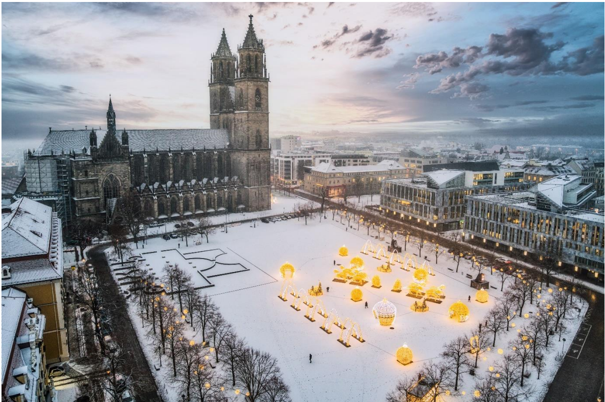
Ein Foto des Domplatzes mit Lichterwelt, Dom und Dommuseum, das sich auch im Dom-Kalender 2024 findet.

in diesem Jahr ging alles irgendwie schneller und hektischer, oder? Am Sonntag ist bereits der vierte Advent – zugleich aber auch Heiligabend. Danach ist das Jahr fast schon wieder um.