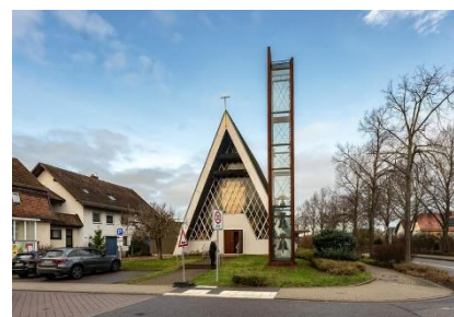
Glockenturm Ev. Matthäusgemeinde Sinzheim, epd-Bild, Foto: Uli Deck

12.02.2024: Christine Süß-Demuth in epd-Wochenspiegel Ost Nr. 07/2024: Wenn der Glockenturm auf dem Kopf steht. Dass die Glocken statt oben plötzlich ganz unten läuten, ist ungewöhnlich. Die Idee dazu kommt aus Karlsruhe und ist nicht nur finanziell bei maroden Glockentürmen interessant. Beim Klang gibt es kaum einen Unterschied. In Zeiten knapper Kassen können auf diese Art baufällige oder fehlende Glockentürme vergleichsweise preiswert ersetzt werden. Dadurch sind die statischen und dynamischen Kräfte von mehreren Tonnen auf das Bauwerk wesentlich geringer. Der eigentliche Turm diene dann lediglich als Schallröhre mit Reflektor und könne filigran und leicht ausgeführt werden, erläutert der Experte. Ob Beton, Stahl, Glas oder Holz, das Material spiele dabei keine Rolle. Die Schallaustrittsöffnungen sollten aber höher liegen als die umliegenden Gebäude.