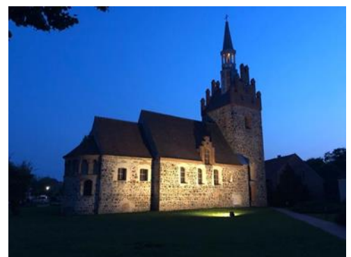
Abenddämmerung in Wittbrietzen

So mancher Besucher des südlich von Beelitz gelegenen Dorfes zeigt sich erstaunt und überrascht, welch anmutige und schöne Kirche da mitten auf dem historischen Dorfanger steht. Von wohlproportionierter Gestalt springt jedem Betrachter zunächst die hohe und imposante Kirchturmspitze ins Auge. Zierde des Dorfes und zugleich häufiges Sorgenkind des Gemeindegemeinderates. Ist diese hölzerne Spitze doch permanent den auch zerstörerischen Kräften des Regens und der Sonne ausgesetzt. Aber auch für viele Wittbrietzenener ist diese Kirche immer wieder ein andächtiger Hingucker und sicher auch ein Fingerzeig Gottes.