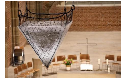
Eispyramide, Kirche Unser Lieben Frauen Bremen

19.02.2024: epd-Wochenspiegel Ost Nr. 08/2024: Schmelzendes Eis und singendes Licht. Unter dem zentralen Gewölbe der gotischen Liebfrauenkirche in der Bremer Innenstadt hängt eine Pyramide aus Eis, mit der Spitze nach unten, so klar wie ein Bergkristall. 330 Kilogramm, die sich langsam auflösen. Ein paar Meter weiter unten steht eine große Metallschale, die jeden Tropfen auffängt. „Eternity“ – Ewigkeit - heißt die Kunstaktion der Münchner Künstlerin Birthe Blauth. Rund um die Wasserschale stehen Kirchenbänke und Decken liegen bereit. Sie laden ein, das von mehreren Scheinwerfern angestrahlte Schauspiel Tag und Nacht in Ruhe zu verfolgen. Das Eis steht im Dialog mit den Kirchenfenstern von Alfred Manessier. Wenn die Sonne durch die Fenster scheint, entstehen überall bunte Tupfen in allen Regenbogenfarben, die auf rotem Backstein leuchten, manchmal, durch die Glasbrechung, auch tanzen.