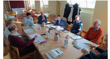
Kuratorium Studienstiftung 21.03.2026