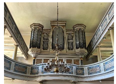
Orgel und Emporenbrüstung in der Dorfkirche Biesenthal (Barnim)