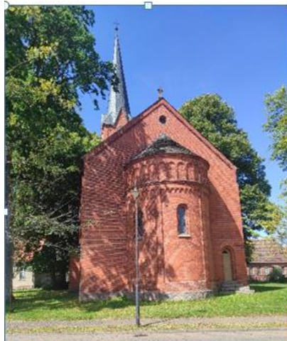
Dorfkirche Dranse

Weitere Informationen: Dorfkirche Dranse , Dranser Dorfstraße 33, 16909 Wittstock OT Dranse Ev. Kirchengemeinde zwischen Dosse und Heide , Gemeindebüro, St.-Marien-Str. 8, 16909 Wittstock, Tel. 03394-4029475, dana.krsynowski@gemeinsam.ekbo.de , www.kirche-wittstock-ruppin.de Spendenkonto: Förderkreis Alte Kirchen Berlin-Brandenburg e.V., DE94 5206 0410 0003 9113 90 Verwendungszweck: Dranse (OPR)