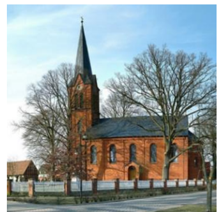
Kirche in Dranse