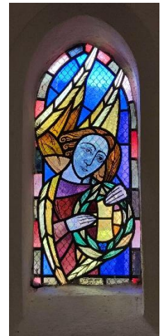
Fenster in der Wesenberger Kirche