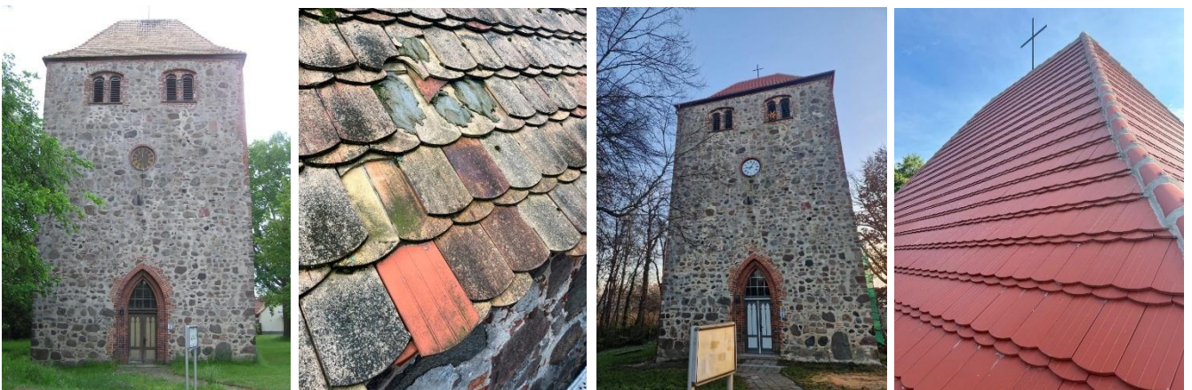
Batzlower Turm und sein Dach vor und nach der Sanierung 2025, Fotos: ibs/ Ronny Behrendt

Der zweite Bauabschnitt zur Sanierung der massigen Feldsteinkirche in Batzlow umfasste die Hüllensanierung des Kirchturms und dabei die tragende Konstruktion (Holz, Mauerwerk, Mauerkrone) sowie das Erneuern der Dachfläche. Die mit 192.500 Euro beantragte Baumaßnahme kostete aufgrund der vorher nicht erwarteten zusätzlichen Mängel letztlich 267.643,72 Euro, die aus verschiedenen kirchlichen Fördertöpfen finanziert wurden. Der Förderkreis Alte Kirchen gab 5.000 Euro dazu, die als Eigenmittel angesetzt werden konnten. Die Batzlower Kirche wird in der Gesamtkirchengemeinde Haselberg schwerpunktmäßig für Gottesdienste und Regionalgottesdienste genutzt. Vor Ort sind sehr aktive Gemeindemitglieder, die gut im Ort und auch mit anderen Vereinen im Ort vernetzt sind. Auch katholische Einwohner bringen sich aktiv ein. Es finden neben den Gottesdiensten Konzerte und andere kulturelle Veranstaltungen sowie Angebote für Kinder statt. Es wird immer wieder nach Wegen gesucht, wie die Kirche mit dem Dorfleben verzahnt werden kann.