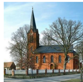
Dorfkirche Dranse

28.06.2026 : die Kirche Nr. 27, S. 12: Dorfkirche des Monats Juni: Dranse . Die Dorfkirche des Monats Juni steht in Dranse im Kirchenkreis Wittstock-Ruppin . Der neoromanische Saalbau aus dem Jahr 1861 in dem Dorf unweit des Früheren Bombenabwurf- und Truppenübungsplatzes stand seit den 1970er Jahren leer. Die Kirchengemeinde und der lokale Förderverein haben verhindert, dass er zur Ruine wurde. Die Sanierung wurde 2024 abgeschlossen. Nun geht es um die Restaurierung der Lütkemüller-Orgel aus dem Jahr 1892 . Leider sind die geplanten Fördergelder nicht gekommen, sodass nun erneut Anträge gestellt und Spenden gesammelt werden müssen.