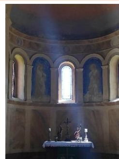
Altar Dorfkirche Dranse

01.06.2026: epd-Wochenspiegel Ost Nr. 23/2026: Dorfkirche des Monats steht in Dranse. Jeden Monat kürt der Förderkreis Alte Kirchen Berlin-Brandenburg eine brandenburgische Dorfkirche des Monats, um Aufmerksamkeit für die Bauwerke zu erzeugen und Spenden einzuwerben. Im Juni ist es die Dorfkirche von Dranse bei Wittstock. Die brandenburgische Dorfkirche aus dem Jahre 1861 stand seit den 1970er Jahren leer. Ein lokaler Förderverein habe verhindert, dass sie zur Ruine wurde und für ihre Sanierung gesorgt. Die Kosten von etwa 350.000 Euro kamen zum großen Teil aus EU-Mitteln, die Sanierung wurde im Sommer 2024 abgeschlossen. Im Anschluss sollte die Lütkemüller-Orgel aus dem Jahre 1892 restauriert werden. Doch die Pläne des Fördervereins und der Kirchengemeinde hätten sich vorerst zerschlagen. Die für 2026 erhofften Fördergelder vom Landesdenkmalamt und der Deutschen Stiftung Denkmalschutz (DSD) würden vorerst nicht kommen. Sie sollten etwa zwei Drittel der Gesamtkosten von 75.000 Euro decken. Nun sollen andere Geldquellen erschlossen und neue Spender gesucht werden.