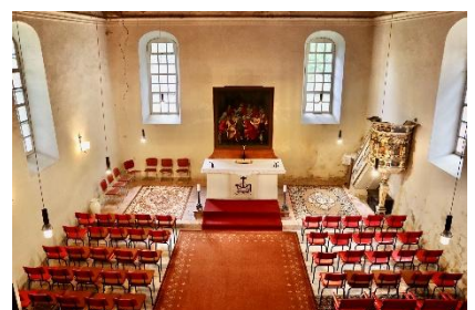
Kircheninnenraum in Petersdorf, Fotos: Philipp Schauer