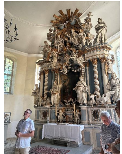
Oben: Barocker Altar Markau, Unten: li. Markee, re. Wagenitz