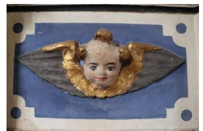
Dorfkirche Petersdorf, Detail an der Kanzel