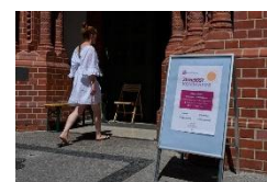
Berliner Hitzehilfe: Kühle Kirchen

22.06.2026: epd-Wochenspiegel Ost Nr. 26/2026: Offene Kirchen an heißen Tagen. Zahlreiche Kirchengemeinden beteiligen sich in diesem Jahr wieder an der Berliner Hitzehilfe und laden bei hohen Temperaturen zum Aufenthalt in kühlen Kirchen ein. Insgesamt beteiligten sich bislang 13 evangelische Sakralbauten an der Aktion „Kühle Kirchen“. Das sind die Lindenkirche in Wilmersdorf sowie die Parochialkirche, die Marienkirche, die Friedrichswerdersche Kirche, die Passionskirche und die Taborkirche im Kirchenkreis Mitte. In Reinickendorf bietet die Johanneskirche Schutz an heißen Tagen, in Spandau sind es die St. Nikolaikirche, die Dorfkirche Kladow und die Wichernkirche. Abkühlen können sich die Menschen zudem in der Dreifaltigkeitskirche Lankwitz, der Apostel-Paulus-Kirche in Schöneberg und der Johanneskirche Schlachtensee. „Manche der Kirchen haben feste Tage, an denen sie geöffnet sind, andere öffnen nur an Hitzetagen“, sagte Janes von Moers, Leiter des landeskirchlichen Umweltbüros. Das hänge unter anderem davon ab, wie viele Ehrenamtliche jeweils für Aufsicht und Betreuung zur Verfügung stehen.